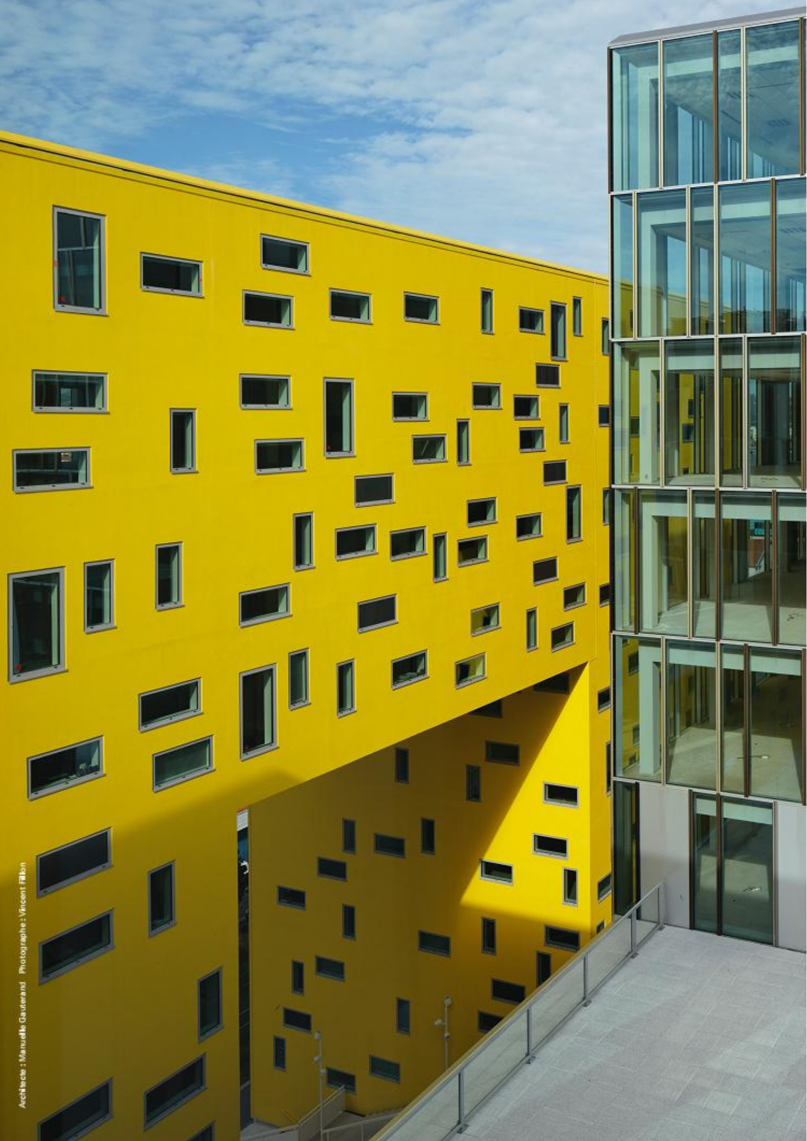
Architecte : Manuelle Gautrand